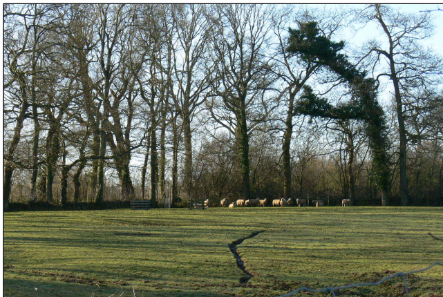
Montbroc côté Parfouru

Le conseil municipal de Parfouru, se réunit pour répondre à la provocation de la commune de Monts qui constitue une véritable déclaration de guerre et pour affirmer son bon droit.