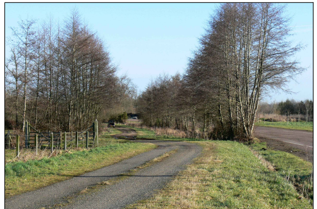
Montbroc côté Noyers

1. « De tout temps les habitants de Parfouru ont pâturé leurs bestiaux en commun avec les communes voisines dans les Bruyères de Montbroc sans aucune limite. »