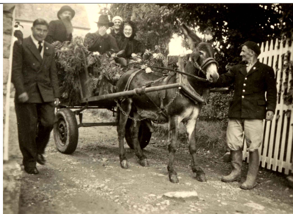
char fleuri devant la maison Bellissent