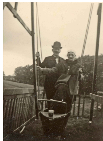
une demoiselle sur une balançoire

Le soir enfin se tenait à nouveau le bal, tout aussi animé que la veille et qui pouvait bien se prolonger aussi fort avant dans la chaude nuit d'août.