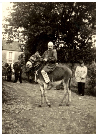
Vainqueur de la course d'ânes

« Après le repas, on retournait à la fête en promenade et pour faire plaisir aux enfants qui participaient aux courses en sac, aux courses à pied et aux jeux qui leurs étaient destinés... »