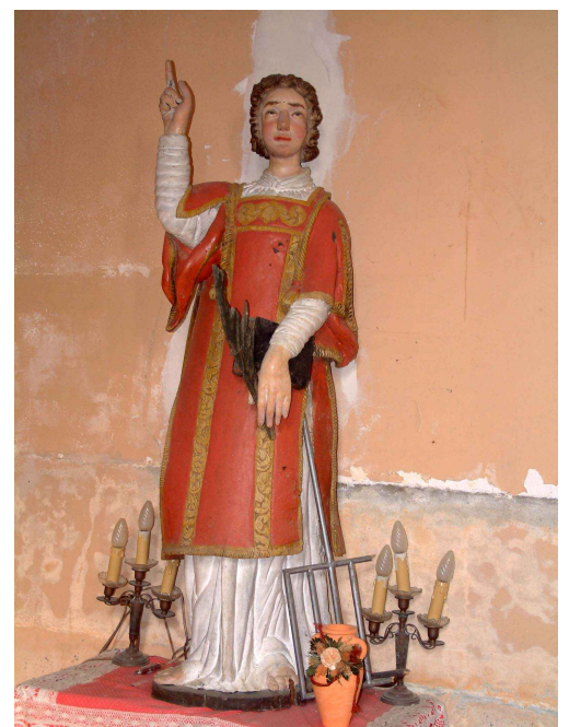
Ci-dessus : statue de saint Laurent visible en l'église de Parfouru

De 10 à 15 ans, j'ai vécu toutes les fêtes de Parfouru, la Saint-Laurent était une des grandes dates de l'année, c'était la fête paroissiale et 6 mois après Noël, c'était l'occasion de réunir toute la famille. »